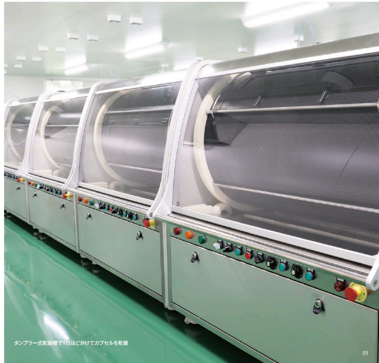
タンブラー式乾燥機で1日ほどかけてカプセルを乾燥

と時間をかけて適度な柔らかさと硬さを併せ持ったカプセルに仕上げ、最後にすべての形状や大きさに異常がないか確認した後、製品にしています。 これらの製造工程はすべて、GMP (Good Manufacturing Practice) 適正製造規範のガイドラインに則った健康食品GMP認定工場にて行われています。最新鋭の設備と国内屈指の管理体制を誇る工場と製造し、心を込めて「INNER-EX」をお届けしています。